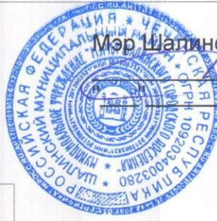
СХЕМА выбора земельного участка под инвестиционную площадку в г.Шали

УТВЕРЖДАЮ: Мэр Шалинского городского поселения У.М. Домбаев 2014г.